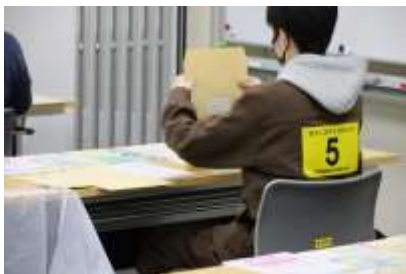
オフィスアシスタント