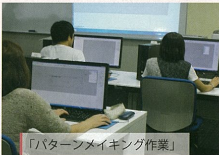
「パターンメイキング作業」