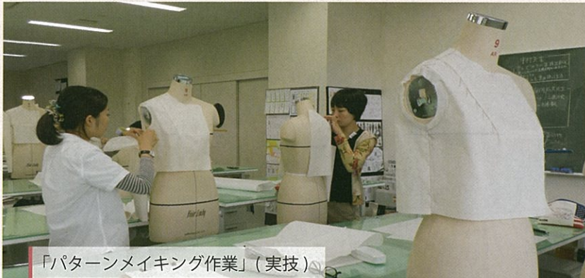
「パターンメイキング作業」(実技)