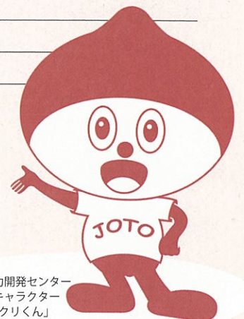
城東職業能力開発センター イメージキャラクター 「ものづくりくん」