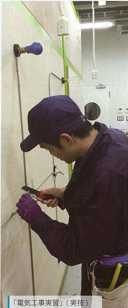
「電気工事実習」(実技)