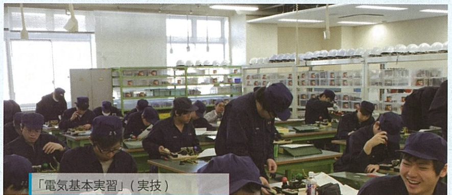
「電気基本実習」(実技)