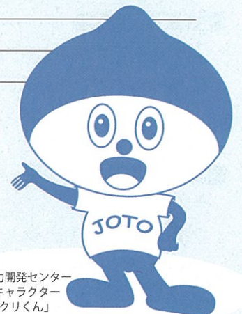
城東職業能力開発センター イメージキャラクター 「ものづくりくん」