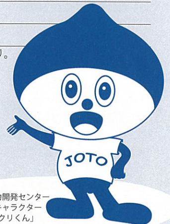
城東職業能力開発センター イメージキャラクター 「ものづくりくん」