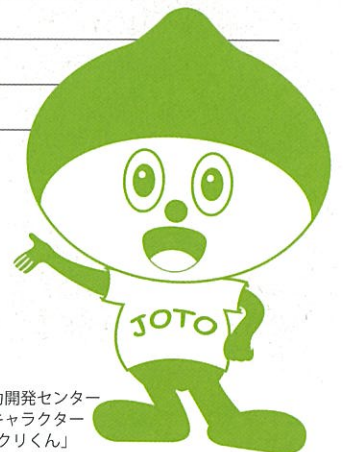
城東職業能力開発センター イメージキャラクター 「ものづくりくん」