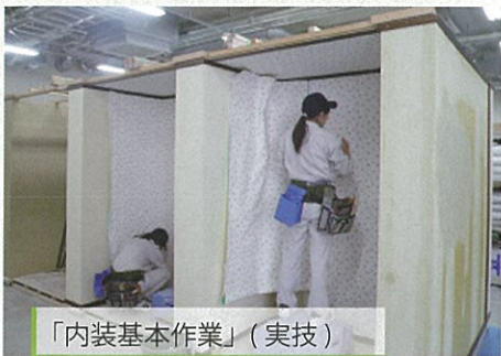
「内装基本作業」(実技)