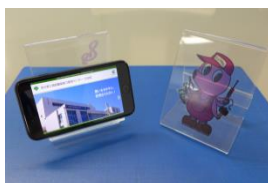
スマートフォン用スタンド

・アクリルの加工は、初めてなのでワクワクしました。 ・校内の雰囲気や設備が知れてよかった。