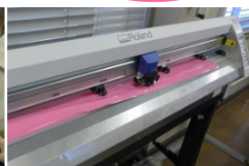
カッティングマシン