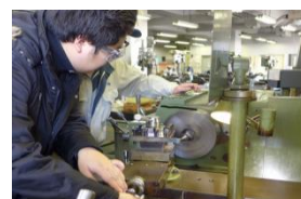
汎用旋盤による切削加工