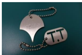
金属製キーホルダー

・自分が入校した時を想像すると、とても楽しみのになった。 ・新鮮な体験が出来た。