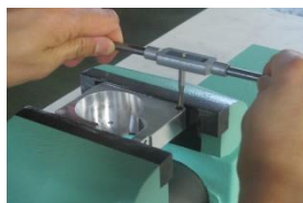
タップによるネジ切り加工