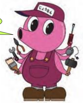
イメージキャラクター 城南たっくん