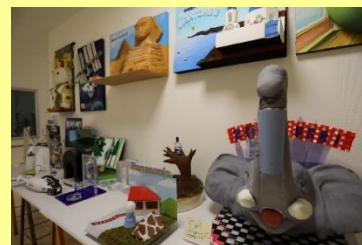
生徒作品(POP広告、立体レリーフ等)