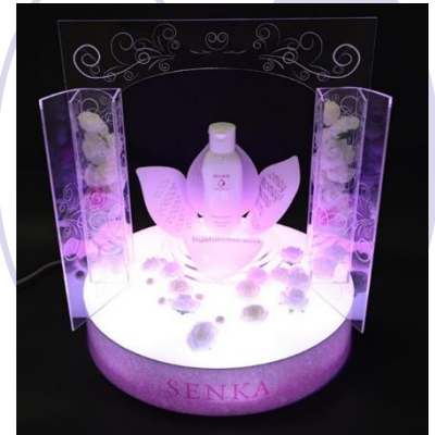
広告美術科生徒による作品