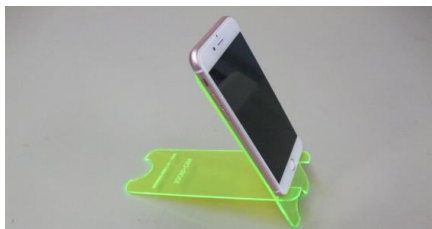
スマートフォン・スタンド(3DCAD・CAM科)