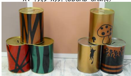
貯金箱(若年者就業支援科)