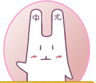
センター公式キャラクター「なかっキー」