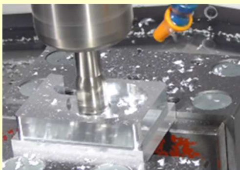
マシニングセンタによる切削加工